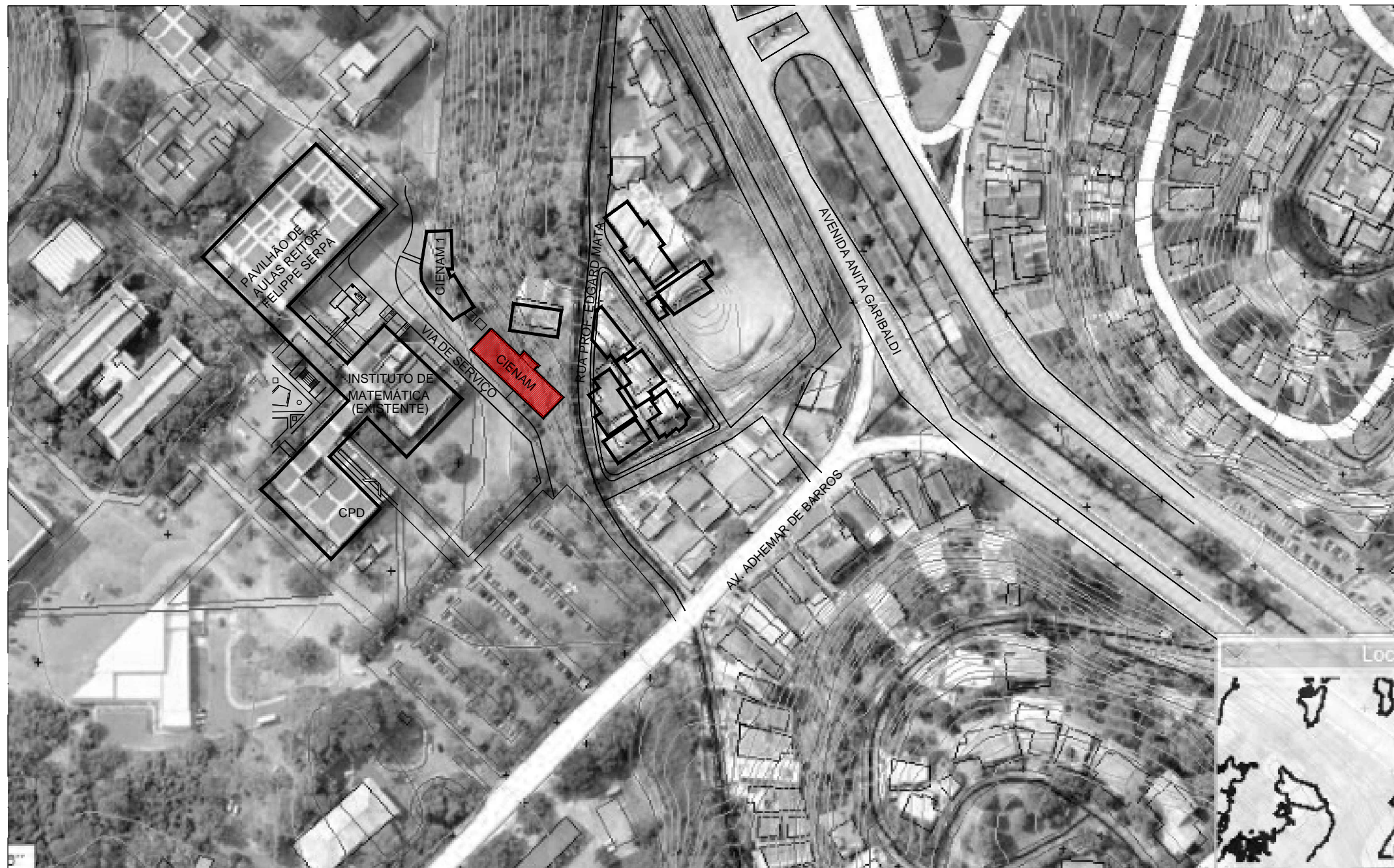
MAPA DE LOCALIZAÇÃO ESCALA 1/2000